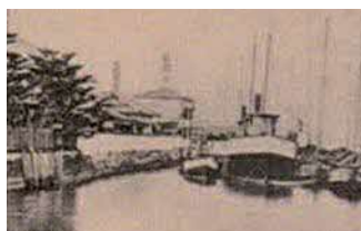
明治元年当時の運上所

大阪税関の前身は、慶応3年8月(1867年9月)、運上事務(現在の税関の仕事)及び外交事務を取り扱うため、現在の大阪市西区川口に開設された川口運上所です。