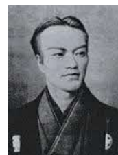
五代友厚 (写真) 国立国会図書館蔵

明治・大正時代には、大阪の商工業の発達に伴う著しい貿易の伸長とともに本関庁舎を大阪市港区築港の現在地へ移転しました。